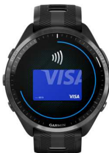
Garmin Pay 1